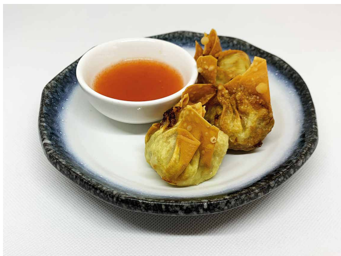
Wanton fregit de carn de porc i gambes amb salsa agre-dolça.