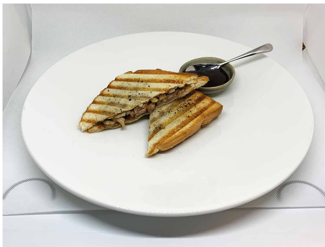
Biqini farcit d'd'ànec Pequín, ceba tendre i salsa hoisin.