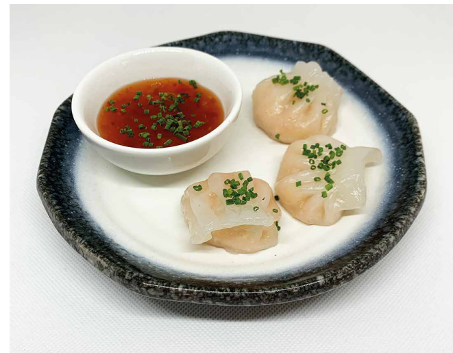
Hacao de pasta d'arròs i tapioca, farcit de llagostí i castanyes d'aigua amb salsa "sweet-chelli".