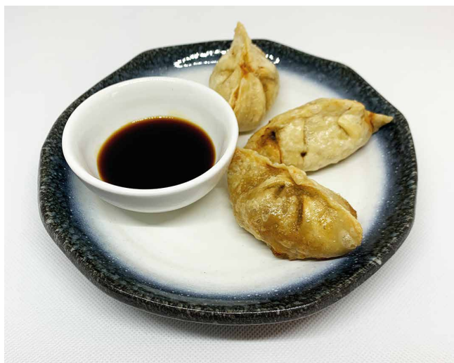
Jiaozi. Dim Sum de carn, carabassó, ceba tendre i gingebre amb salsa de soja.